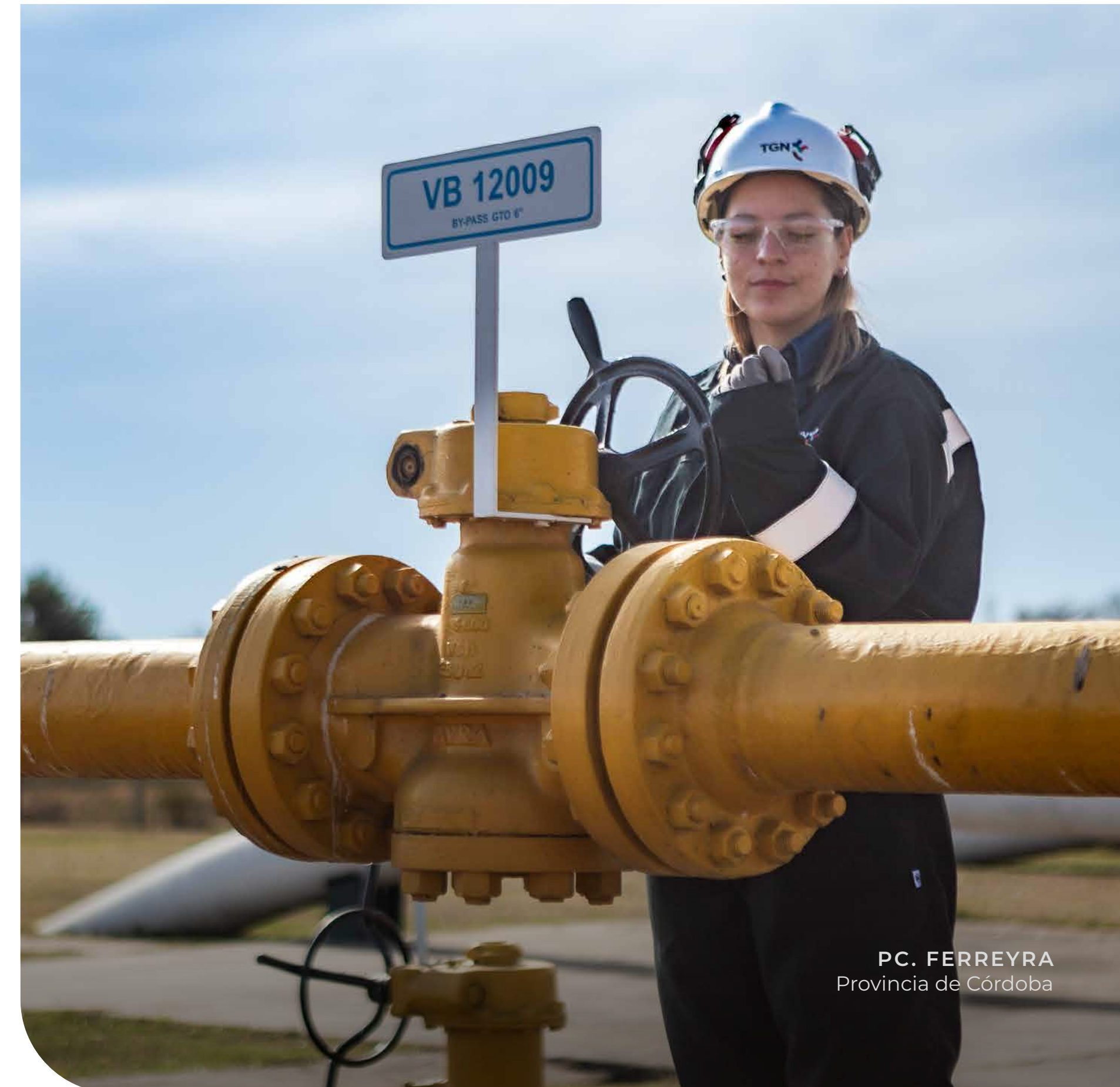
PC. FERREYRA Provincia de Córdoba

Si actuamos en contra de estos principios, podemos enfrentar medidas disciplinarias, que podrían incluir el fin de nuestra relación laboral o contractual, además de las acciones legales que correspondan.