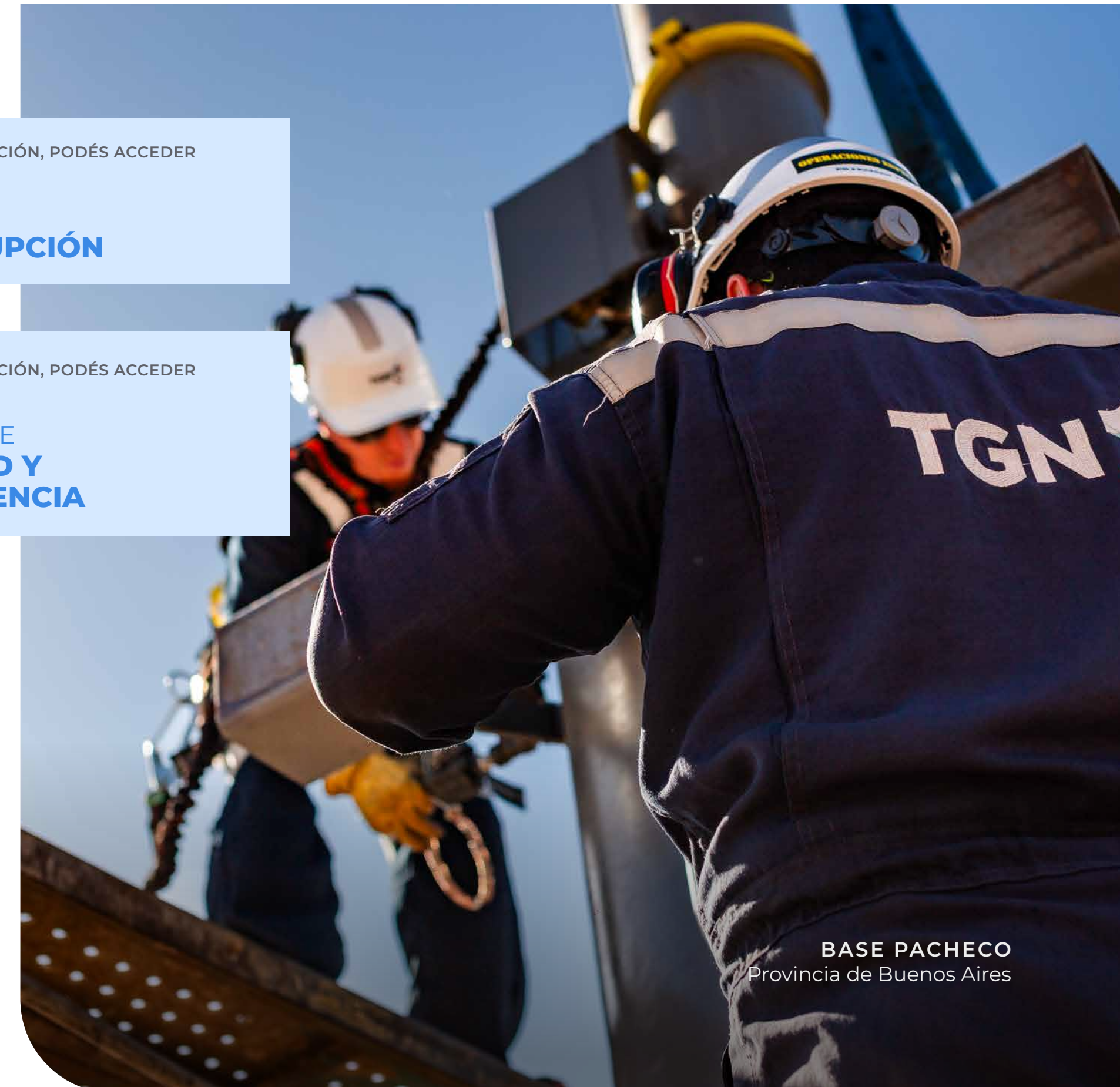
BASE PACHECO Provincia de Buenos Aires